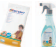
Cage cleaning wipes & spray Art.nr.: 3371 - 3372