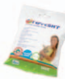
Sensitive wipes Art.nr.: 3370