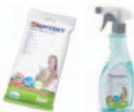
Cage cleaning wipes & spray Art.nr.: 3368 - 3369