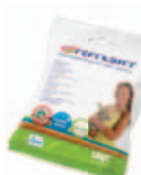
Deodorising wipes Art.nr.: 3367