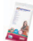
Grooming wipes Art.nr.: 3363