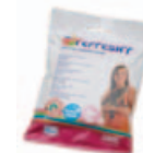
Sensitive wipes Art.nr.: 3366