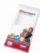
Deodorising wipes Art.nr.: 3360