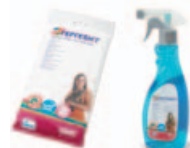
Litter tray wipes & household cleaner, Art.nr.: 3364-3365