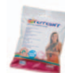
Sensitive wipes Art.nr.: 3366