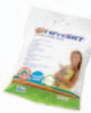
Sensitive wipes Art.nr.: 3370