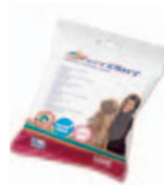
Sensitive wipes Art.nr.: 3362