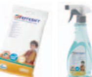
Cage cleaning wipes & spray Art.nr.: 3371 - 3372