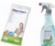
Cage cleaning wipes & spray Art.nr.: 3368 - 3369