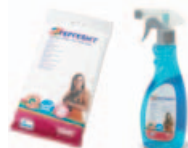
Litter tray wipes & household cleaner, Art.nr.: 3364-3365